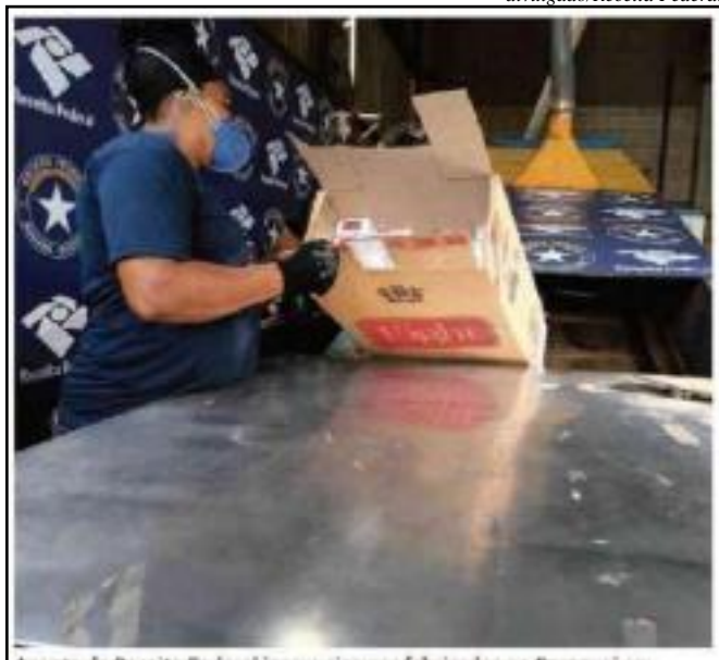
Agente da Receita Federal insere cigarros fabricados no Paraguai em máquina para destruição em Foz do Iguaçu (PR)