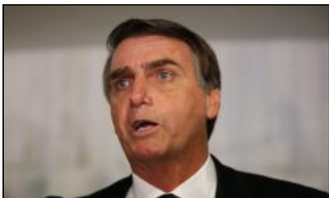
Jair Bolsonaro

Dos 149.912 pedidos pendentes de exame ("backlogs") no Instituto Nacional da Propriedade Industrial ( INPI ) em agosto de 2019, mais de 65% já foram eliminados, faltando cerca de 50 mil para serem resolvidos. Nas divisões de metalurgia e cosméticos, a meta já foi 100% atingida.