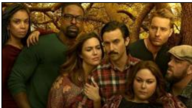
Star+ deve ter conteúdos mais adultos, como This Is Us