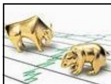
Força dos comprados e vendidos na CBLC, no mercado de opções, tendência, petrobras, vale, suporte e resistência, ibovespa, bolsa de valor, Titulares e lançadores, venda descoberta, opções descobertas, travados, cobertos.